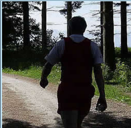
Km 20 - durch die Bäume blitzen die Alpen