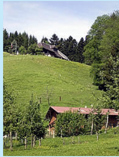
Idylle entlang der Strecke