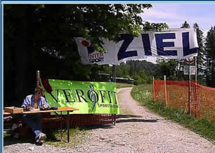
Das Ziel für die 25 km-Läufer

An der Verpflegungsstelle bei km 25 (derer gab es alle 5 km, am Ende noch mal eine mehr bei km 47) erzählten mir die Sanitäter, daß sie schon mehrfach im Einsatz gewesen wären – klar, inzwischen war es schon knackig heiß geworden. Ich unterhielt mich kurz mit zwei Schweizern, die ich schon ungefähr bei km 10 kennengelernt hatte und an den Verpflegungsstellen immer wieder traf und die erstaunt waren, daß meine Beine noch keinerlei Ermüdungserscheinungen zeigten. Wie jetzt? Schon bei km 25? Das wäre vielleicht doch noch ein bißchen früh.