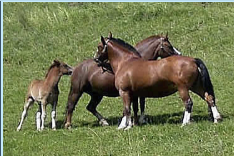
Pferdefamilie lässt sich von Lauffamilien nicht stören