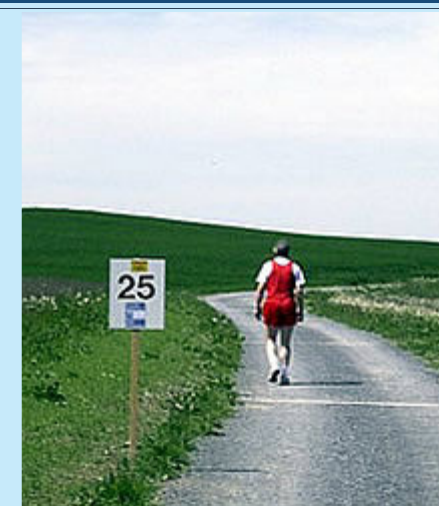
Die Hälfte ist geschafft