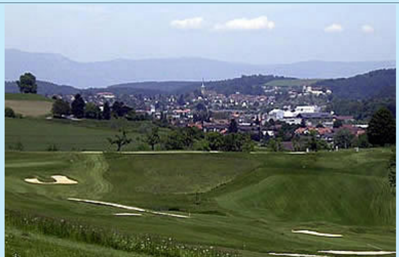
Golfplatz mit Burgdorf dahinter