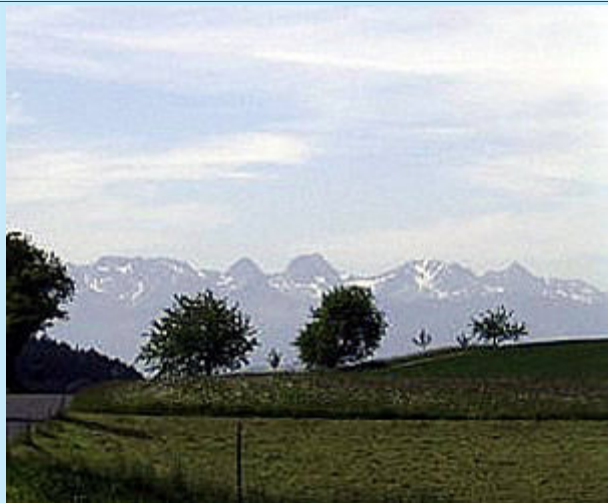
Erster überraschender Blick auf die Berner Alpen

Die ersten 10 km waren, von der beschriebenen Steigung mal abgesehen, relativ flach und damit gut lauffbar. Aber dann ging es 15 km fast stetig bergauf, mit kleineren Wellen zwischen km 17 und 21. Auf dem Weg dorthin konnten wir vor allem viel sattes Grün bewundern, Traktoren beobachten, die so schräg im Berg fahren, daß ich mir schon überlegte, wie es kommt, daß die nicht umkippen. Wir kamen vorbei an arbeitenden Bauern, die sich wahrscheinlich fragten, was diese ganzen Verrückten da entlang ihrer Felder machen und natürlich an Unmengen von Kühen und Pferden. Das alles war schon so schön, daß sich bei mir fast sofort ein Urlaubsgefühl eingestellt hatte.