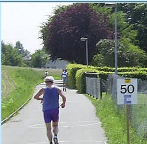
Fast das Ende

Die Zielverpflegung war etwas dürftig, die Duschen dafür richtig heiß und die Massagebänke waren leider schon zusammengeklappt, bis ich sie nach Dusche und erster Kurzmahlzeit belagern wollte. Schade, denn der Zielschluß für alle war, weil ja viele Wanderer auf der Strecke waren, erst um 19 h und ich kam auch von den LäuferInnen deutlich nicht als Letzte ins Ziel. Gerechnet hatte ich übrigens mit einer Laufzeit von ca. 6:30 h, die habe ich um fast genau eine halbe Stunde erfreulich deutlich unterboten.