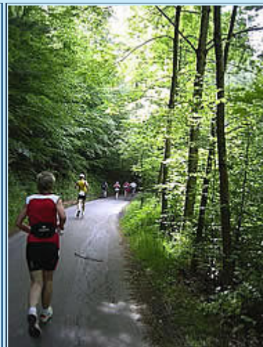
Km 5 - die ersten 25Km-Läufer sind schon unter uns