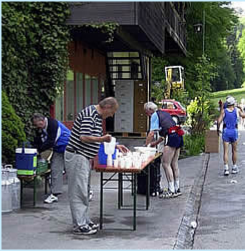
Verpflegung bei Km 10

Aufgrund des Höhenprofils (ca. 900 Höhenmeter sind zu bewältigen) hatte ich mich am Freitag entschlossen, erstmals einen Wettkampf komplett ohne Uhr zu bestreiten. Der Samstag versprach schon morgens ein heißer Tag zu werden, um 7 h zeigte das Thermometer bereits 13 Grad Celcius an, 28 sollten es dann im Laufe der nächsten Stunden noch werden.