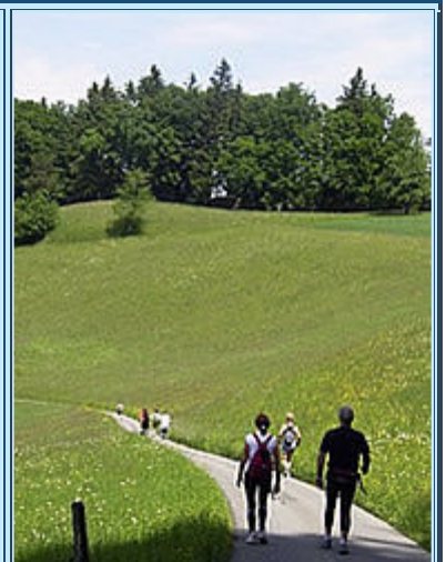
Bergab ging es auch