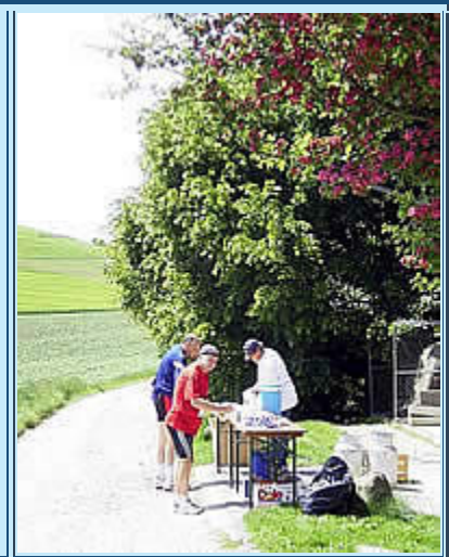
Vorletzte Verpflegung bei Km 44

Ab km 44 wurde es ein wenig unangenehm, weil wir jetzt der prallen Sonne schattenlos ausgesetzt waren, die letzten 5 km führten dazu immer nur schnurgeradeaus an einem Bahndamm entlang, was für sich alleine an diesem Punkt schon ziemlich ermüdend sein kann. Zwischen km 48 und 49 kam noch mal ein kleines Schattenstück, in dem ich gleich 2 Gänge raus nahm, um mich noch ein bißchen zu erfrischen, bevor ich zum Endspurt ansetzte: Schnell noch das km 50-Schild fotografieren und dann die letzten 400 m ab ins Ziel, das sich mitten auf einer Wiese befand. Großhirn an Beine: Ihr könnt stehen bleiben, wir haben ferdisch! Beine an Großhirn: wie? Schon? Schade!