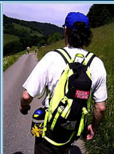
Für viele hier Thema: die 100Km von Biel