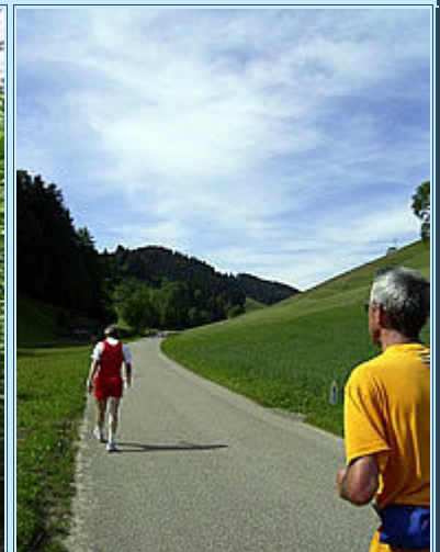
Unendliche Weiten und erste Geher schon kurz nach Km 10

Außer dem 50 km-Lauf wird auch noch eine Wanderung auf derselben Strecke angeboten, die Wanderer haben einen Startkorridor von 7.30 bis 8 h zur Verfügung, die Menschen in den Laufschuhen werden pünktlich um 9 h auf die Strecke geschickt. Zudem gibt es noch einen 25km-Lauf, den nach dem Zielort genannten Mänzliwegglauf – der startet eine viertel Stunde nach dem 50er und zusammen mit den 25ern gehen auch die sog. Teamläufer auf die Strecke. In Deutschland würde das einfach „Staffel“ heißen, 2 Läufer teilen sich die 50,4 km,